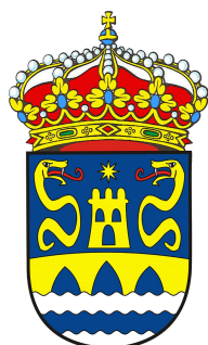
Concello de Cuntis

Temen colaboraron con nós de forma desinteresada: