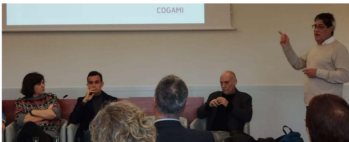
Intervención do Director da área Económica e Financeira de COGAMI no Congreso Nacional Geaccounting, celebrado en Bilbao

Continuamos traballando na implantación da medición do valor social, financiado por CEPES, para implantar e desenvolver instrumentos e ferramentas de información, visibilización, xestión e mellora do valor social xerado no movemento asociativo e nos centros especiais de emprego.