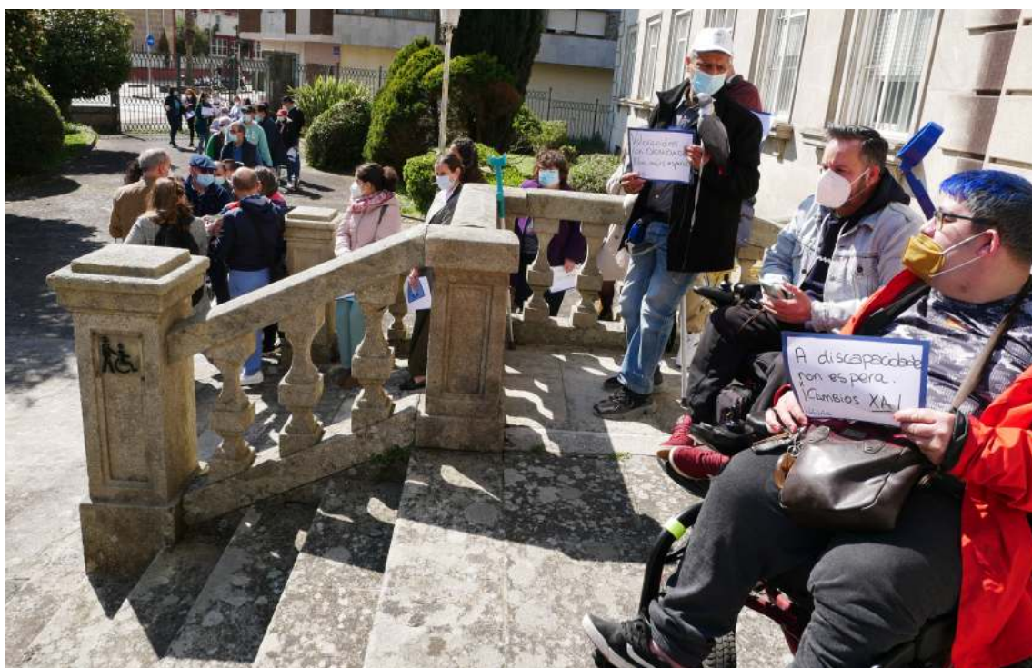
A campaña de denuncia Espera e desespera organizada xunto con COCEMFE diante dos edificios oficiais de valoración da discapacidade, tivo 49 impactos en medios de comunicación galegos e 29.630 persoas alcanzadas en redes

Apoiamos campañas de entidades membro como Días Mundiais e Nacionais, participamos na Campaña X Solidaria, Aporofobia Bancaria, Pobreza Galicia e Emerxencia Vivenda con EAPN Galicia; Inclusión infantil Xa, Propósito de Inclusión, Non Son Invisible con COCEMFE e Que farías ti de ACADAR, entre outras.