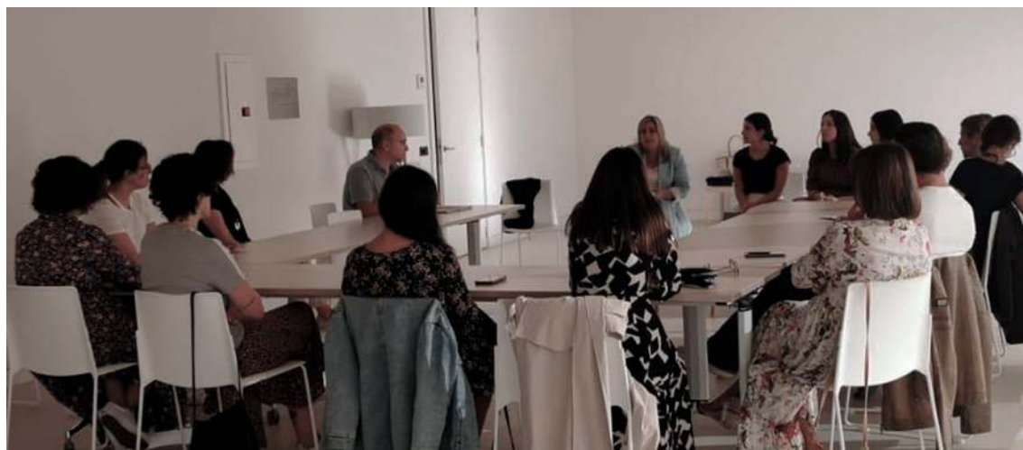
Xuntanza informativa sobre o Servizo de Atención Temprá do Concello con representantes de centros escolares de Arteixo

63 persoas atendidas 1.255 sesións realizadas