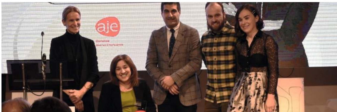
A asociación empresarial AJE Ourense premia a COGAMI