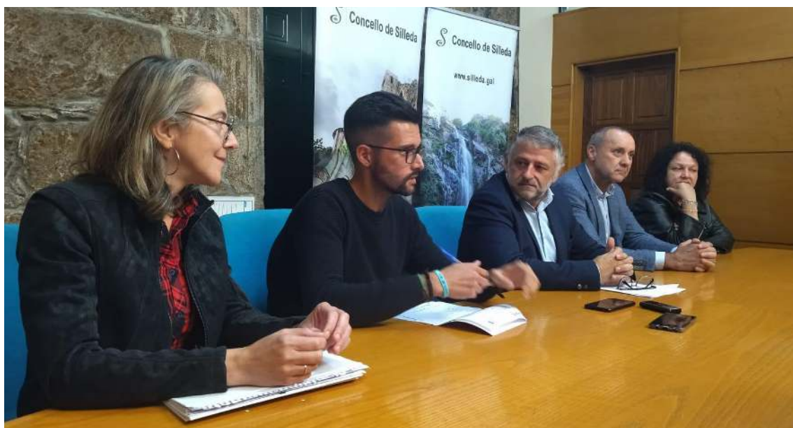
Colaboración co Concello de Silleda para que o centro de Medelo se encargara da elaboración dos adornos de Nadal