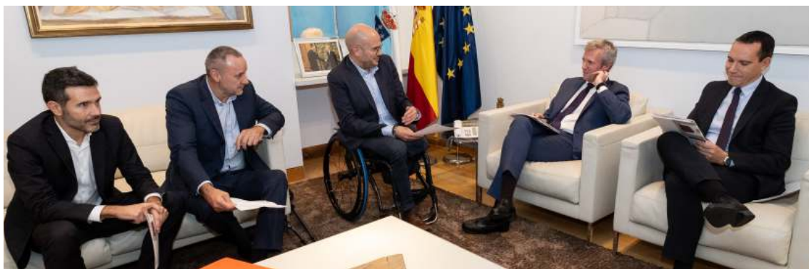
Reunión de COGAMI co Presidente da Xunta de Galicia

Establecemos relacións e alianzas co tecido empresarial, administración pública, fundacións e entidades sociais.