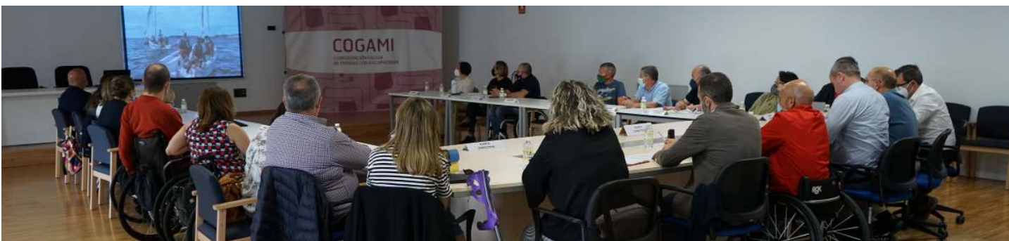
Celebración da Asemblea anual de COGAMI

asociativo, AVIDEPO organizou, como acto principal, no Pazo de Mos, o 'XIV Encontro Galaico-Portugués de Asociacións de Espondilite'. Tratouse dun espazo de actividades científicas e de confraternidade coa entidade homóloga portuguesa ANEA.