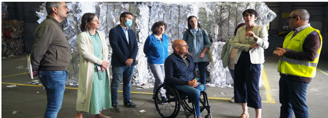
A voceira Nacional do BNG visita a planta de Coregal en Santiago

As recentes modificacións normativas levaron a redefinir ACTIVA Social ETT , dando por cesada a súa actividade e reubicando ao seu persoal, que continúa aportando os seus coñecementos e experiencia na Organización.