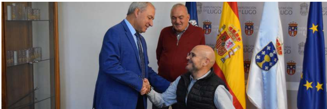
Convenio coa Deputación de Lugo

Fomentamos a participación con outras entidades afíns, como CERMI Galicia, EAPN Galicia e COCEMFE. Formamos parte dos seus grupos de traballo, co fin de mellorar a calidade de vida das persoas con discapacidade.