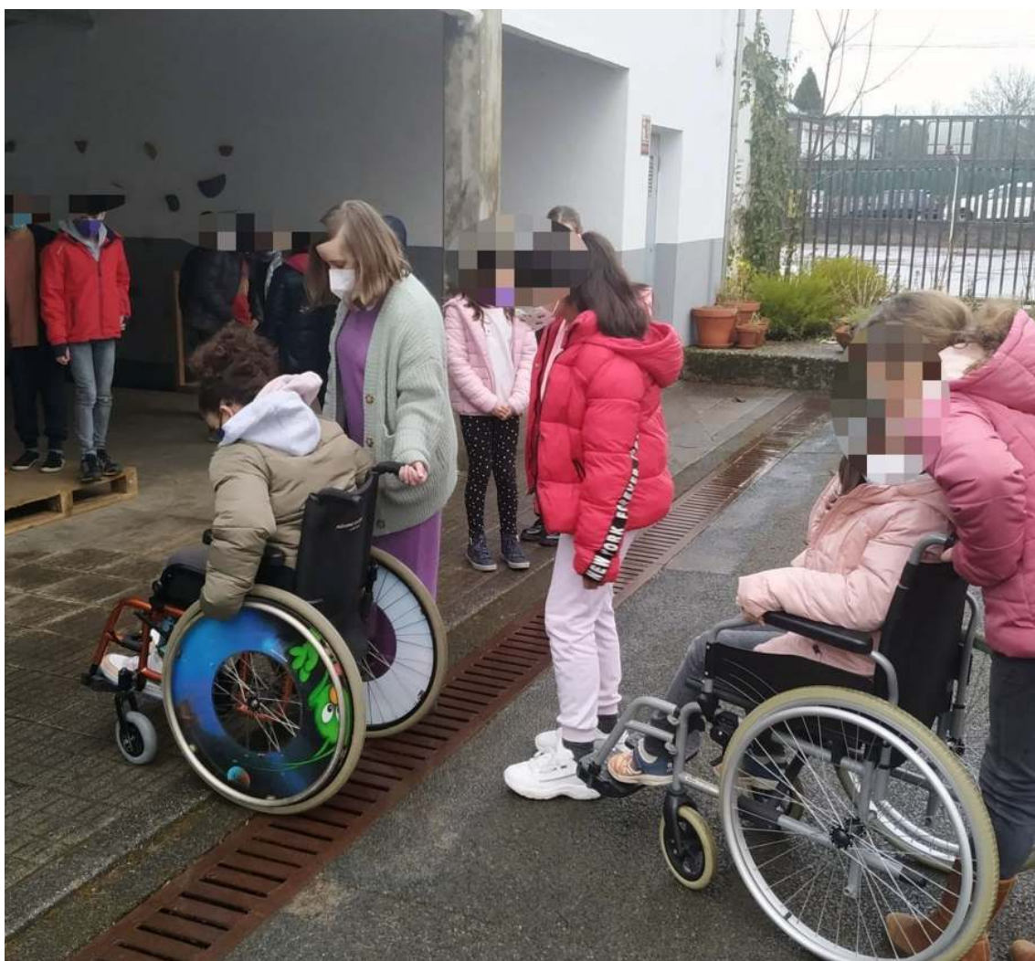
Xornada de sensibilización no CEIP Mestre Rodríguez Xixirei da Lavacolla en Santiago

89 xornadas e charlas 1.676 participantes 8.380 persoas beneficiarias