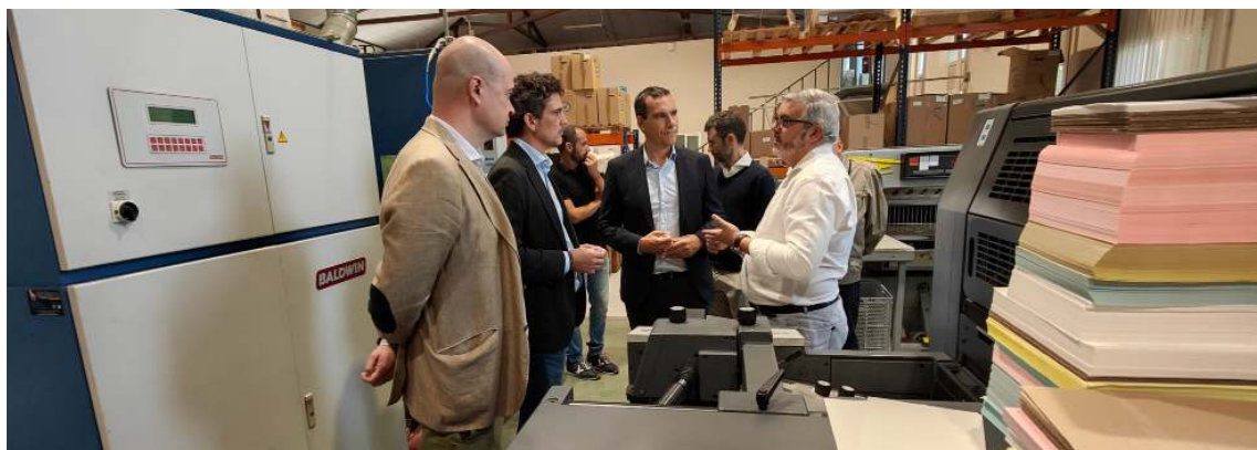
O Director Xeral de Persoas con Discapacidade visita as instalacións de Grafanco

A tenda outlet Massimo Dutti cumpriu 15 anos de traxectoria.