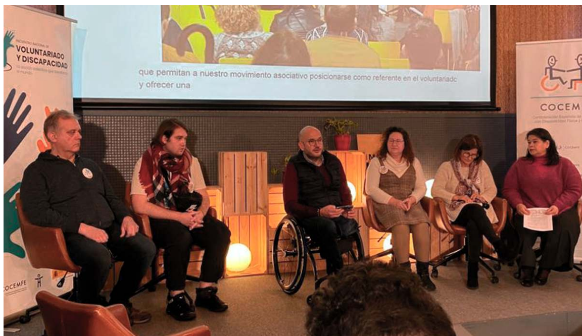
Persoas voluntarias de COGAMI participaron no Encontro Nacional de Voluntariado e Discapacidade celebrado en Madrid

Media de 200 participantes 6.040 persoas beneficiarias