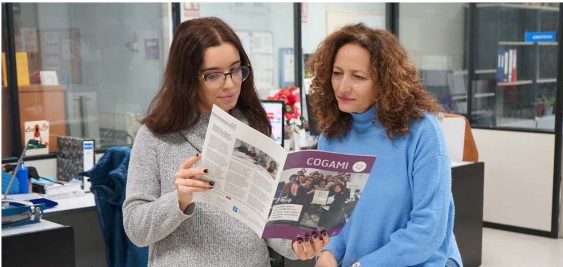
Profesionais da área de Emprego consultan as novidades de O Boletín de COGAMI

Puxemos en marcha a nova web de Alentae e a do proxecto europeo Artability+