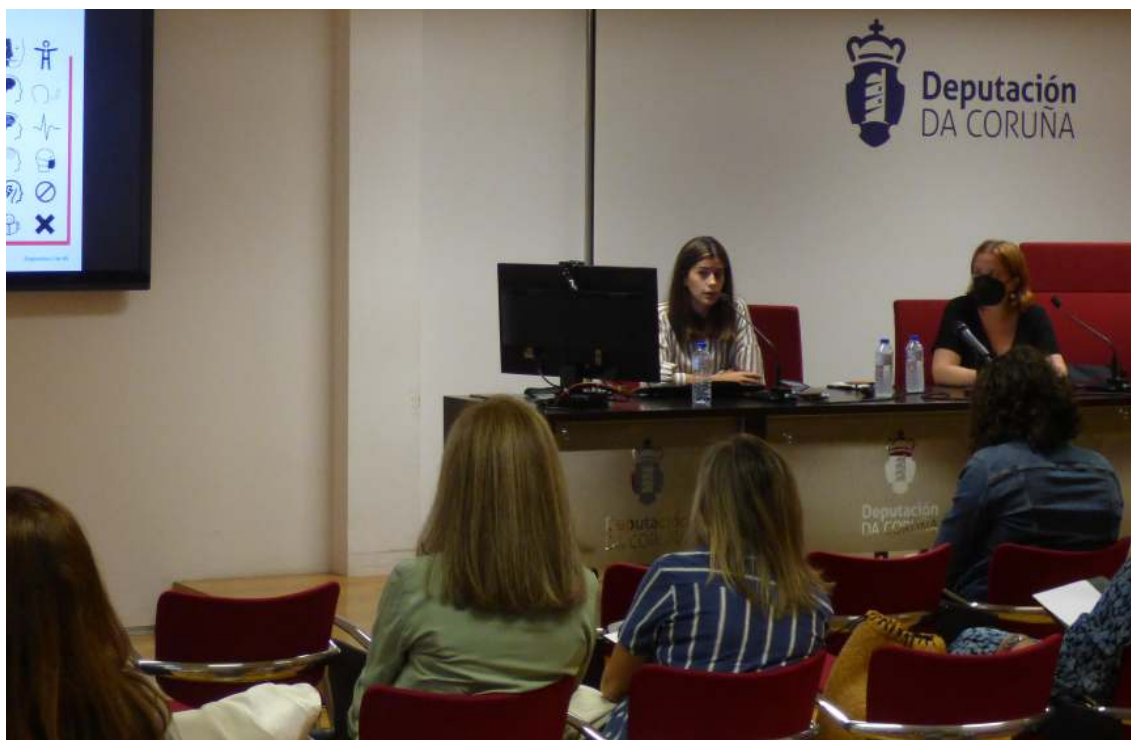
Unha das cinco sesións dirixidas a funcionariado da Deputación da Coruña sobre a atención a persoas con discapacidade