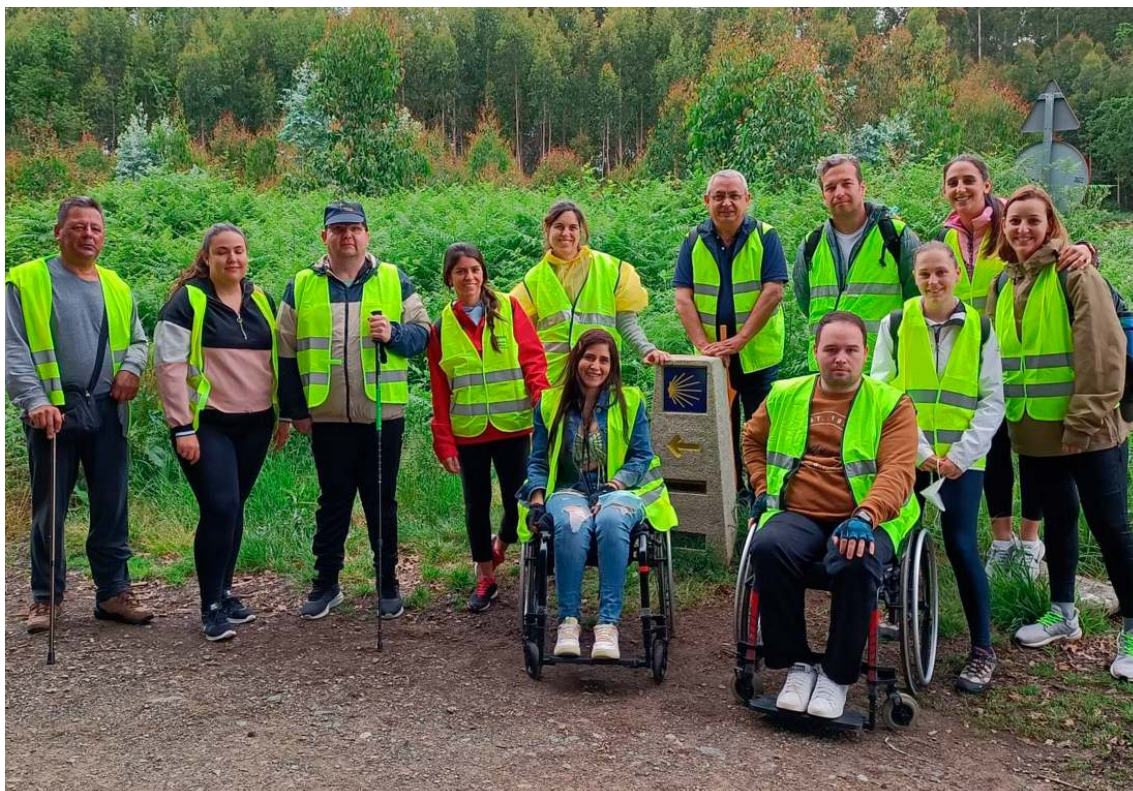
Persoas usuarias do Proxecto Innovador realizan o Camiño de Santiago dende O Pedrouzo

65 participantes Puntuación do grao de satisfacción de 4,8 nunha escala de 5.