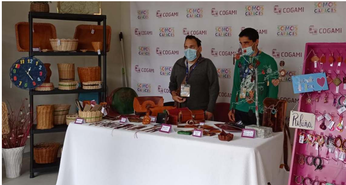
Os centros de atención diúrna aproveitan as feiras dos seus concellos para vender a artesanía que elaboran nos obradoiros