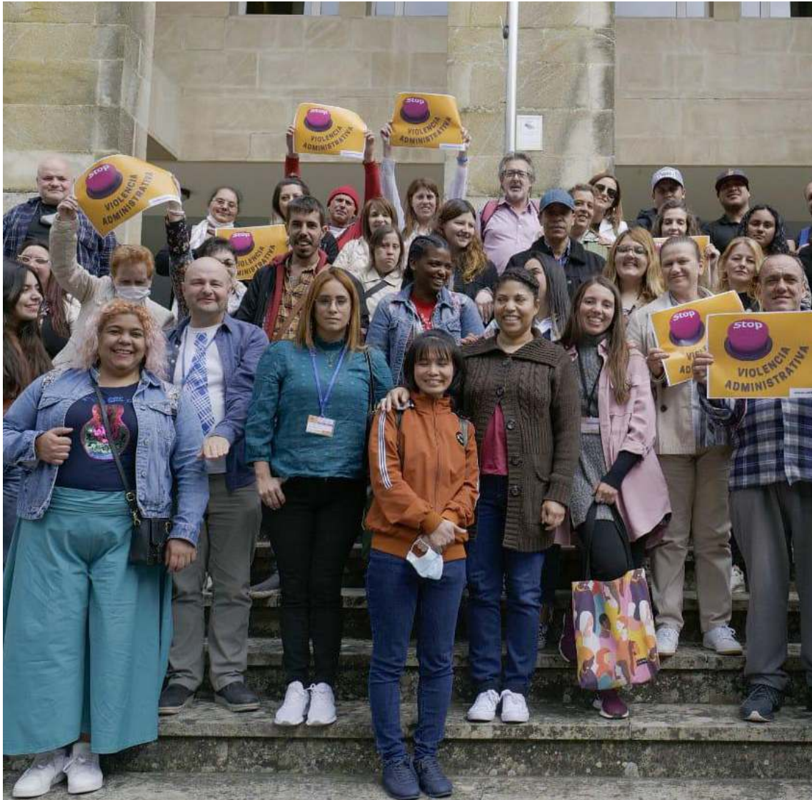
COGAMI foi unha das entidades asistentes no XIII Encontro Galego de Participación organizado por EAPN Galicia