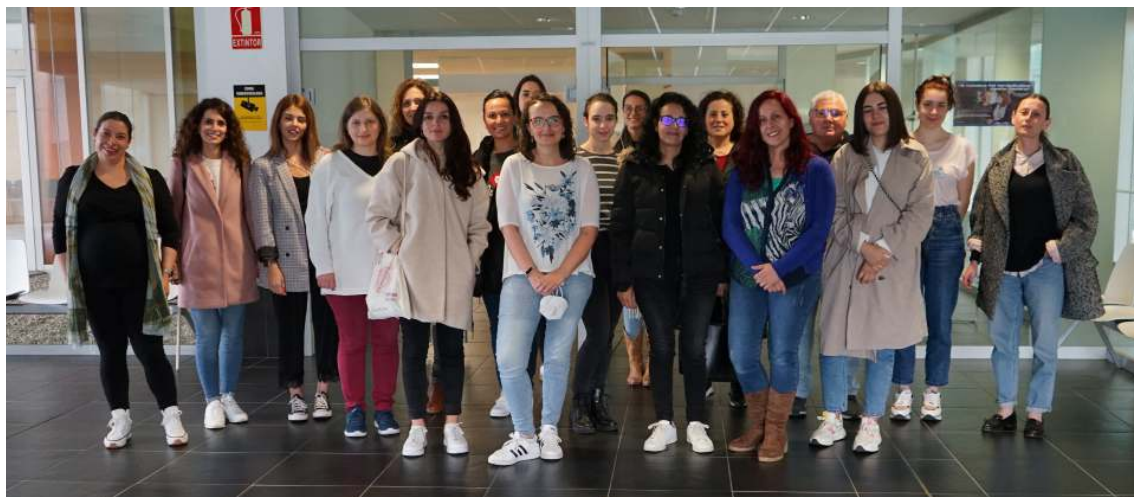
Primeira xuntanza presencial da Comisión Sociosanitaria trala pandemia

9 entidades participantes 8.593 persoas alcanzadas nas redes sociais