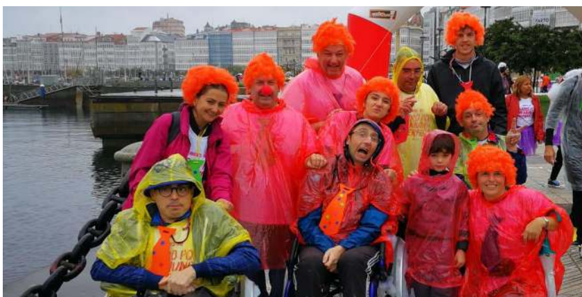
O centro de Ferrol na carreira de Enki celebrada en A Coruña

O Programa ENKI consiste nunha carreira de proba de obstáculos que busca a inclusión das persoas con discapacidade en actividades de carácter lúdico e deportivas. Participaron un total de 18 persoas entre usuarias dos centros de recursos de Fingoi e Ferrol, ademais de profesionais e familiares.