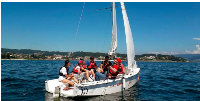
O centro Monteporreiro no programa Lecer Náutico de Sanxenxo

Programa LECER NAÚTICO 148 participantes 10 quendas organizadas