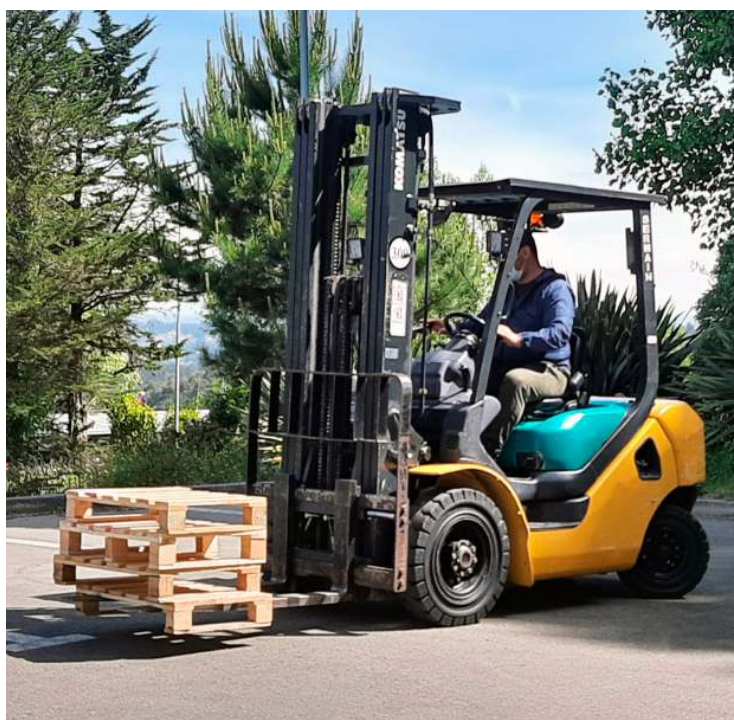
Curso de almacén e carretilla do programa Máis Emprego de Fundación "la Caixa" e FSE

O obxectivo desta formación é a inserción laboral polo que, cando impartimos un curso, temos en conta tanto as necesidades da persoa como as demandas do tecido empresarial da zona.