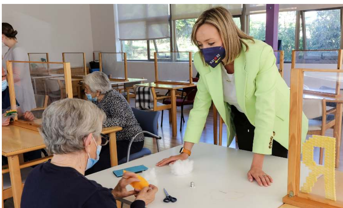
A Conselleira de Política Social visita o centro de día de maiores de Porto do Son