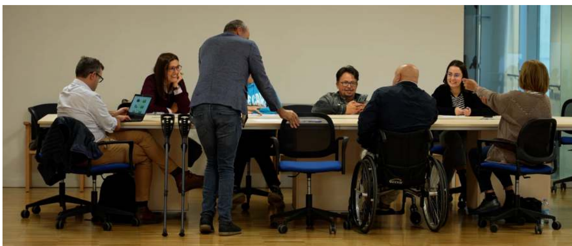
Xunta directiva da Federación COGAMI Coruña, a primeira presencial trala pandemia

56 entidades conforman o movemento asociativo