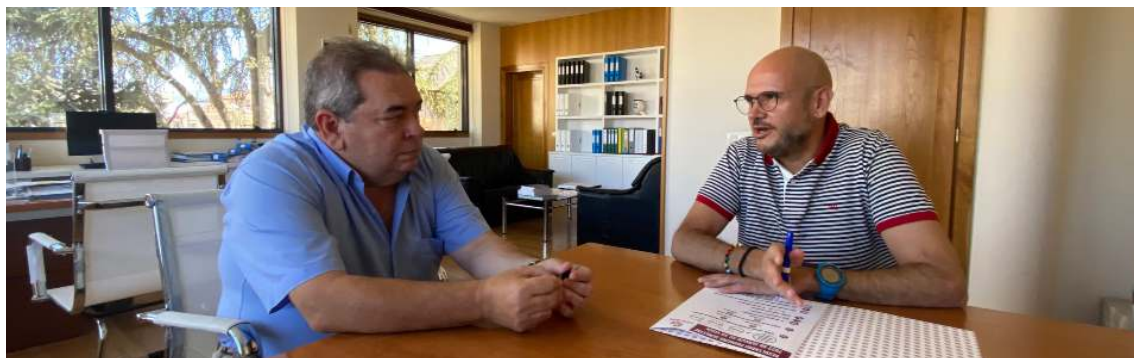
Convenio co Concello de Verín para a cesión de espazos de atención do noso Servizo de Emprego

9% Lugo 35% Pontevedra 44% A Coruña 35% Ourense