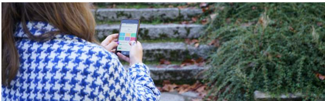
Probando a aplicación móbil do programa Crea Autonomía 2022

Intervención dirixida á inclusión educativa obrigatoria e defensa de dereitos como a autodeterminación, formación inclusiva, normalización e dereito á cota de reserva de praza de menores entre 1 e 17 anos.