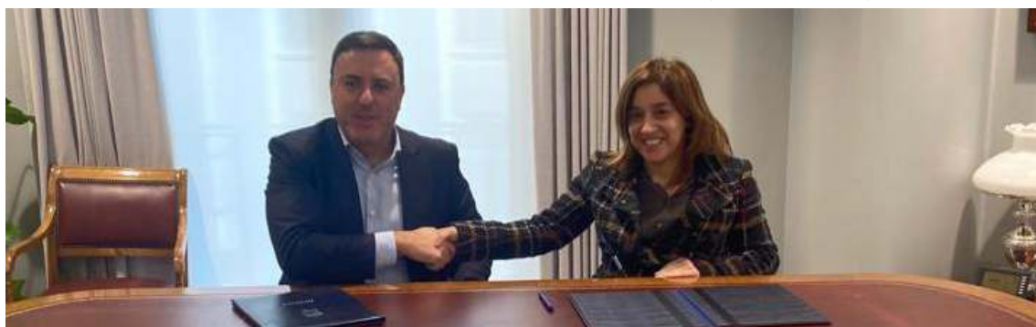
Convenio de COGAMI coa Deputación da Coruña para apoiar o Servizo de Emprego

Participación en Forma-Mos sobre educación e formación // Participación na Rede de Emprego do Concello de Vigo.