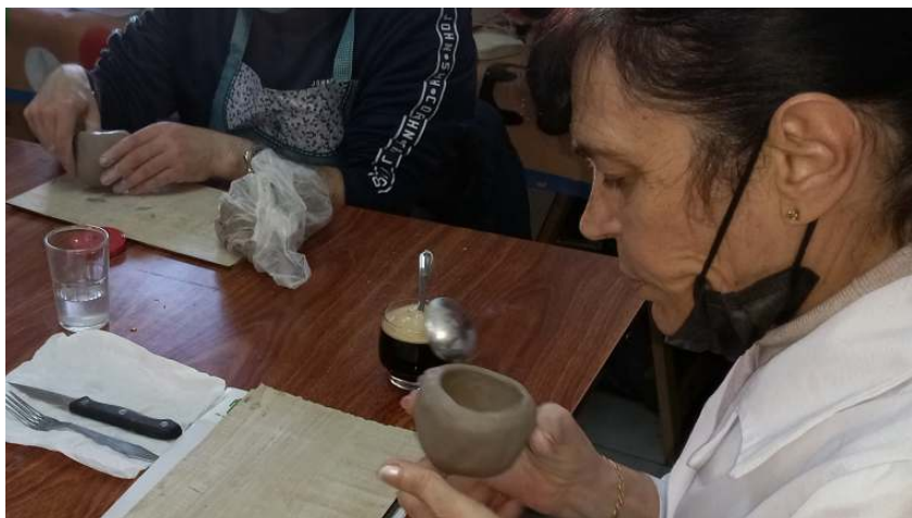
A asociación Disvalia participou en En-RED-Arte nun obradoiro de modelado en barro

A área de Fortalecemento do Movemento Asociativo apoia á rede de entidades de COGAMI, prestando servizos de: información e asesoramento, programación e organización de cursos, sensibilización social e de saúde, xestión de recursos e participación en programas de lecer.