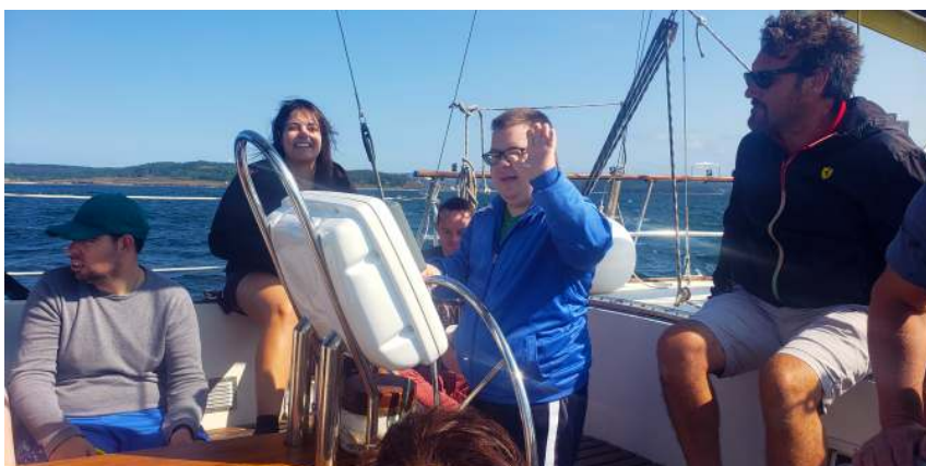
Proxecto Gavea, unha das actividades de lecer máis participativas

É un dos programas máis solicitados polas entidades de COGAMI, porque permite gozar do mar a todas as persoas usuarias que participan. O veleiro Laion chega a COGAMI tras ser incautado pola Audiencia Nacional ao narcotráfico e cedido en garda e custodia á entidade membro Adisbismur.