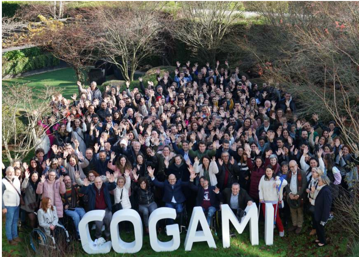
Persoas asistentes á xornada de Nadal de COGAMI