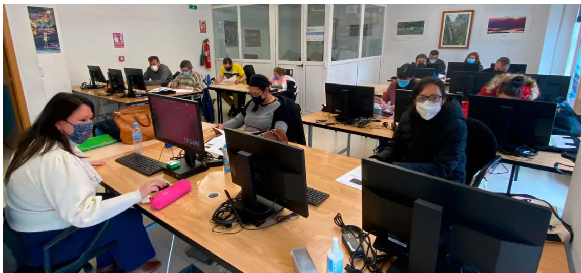
Curso AFD en Ourense de comunicación en lingua castelá