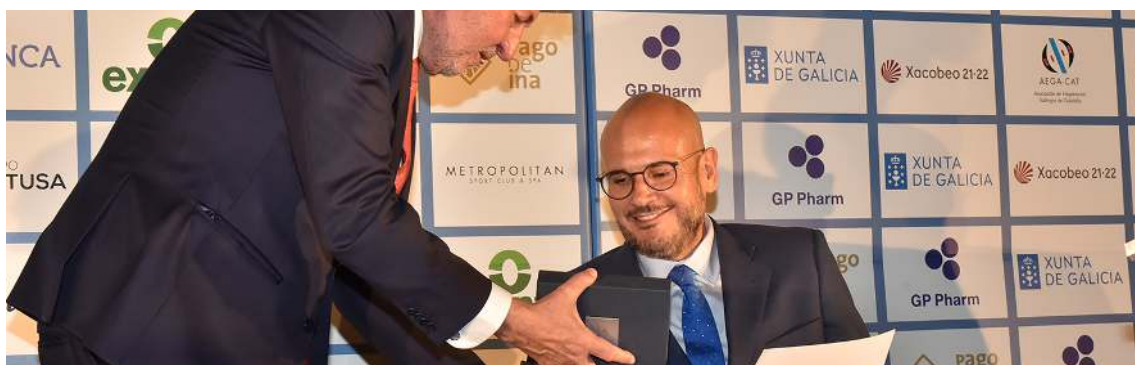
A Asociación de Empresarios Gallegos de Cataluña (AEGA-CAT) premia a COGAMI

Asistimos e participamos en redes, congresos, foros, mesas redondas, charlas e webinars que visibilizan o traballo tanto dentro como fóra da nosa Comunidade.