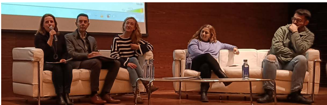
COGAMI participa no acto Estreitando Lazos. Obxectivo Emprego organizado polo Concello de Ferrol

1.892 persoas atoparon emprego. O 63% en empresa ordinaria. O 37% en empresa protexida (CEE)