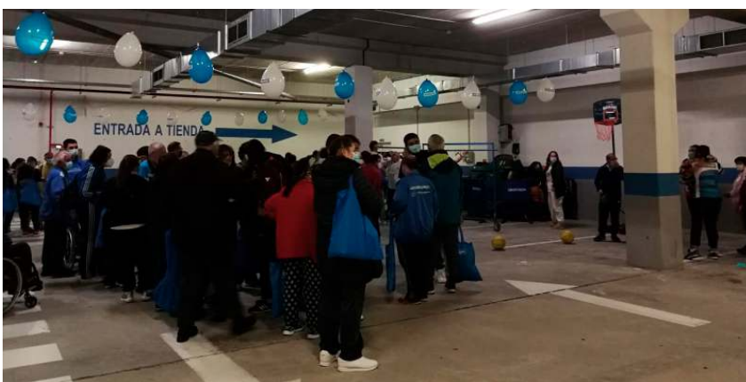
Participación no Día da Fundación Decathlon en Santiago

No Día da Fundación Decathlon, persoas voluntarias desta entidade compartiron xornada deportiva con algunhas das entidades membro de COGAMI. Adisbismur, Misela, Amarai, Medelo e Amico, practicaron en equipo, xunto a outros centros, distintos deportes e xogos como boccia, baloncesto, tenis, ioga ou ximnasia.