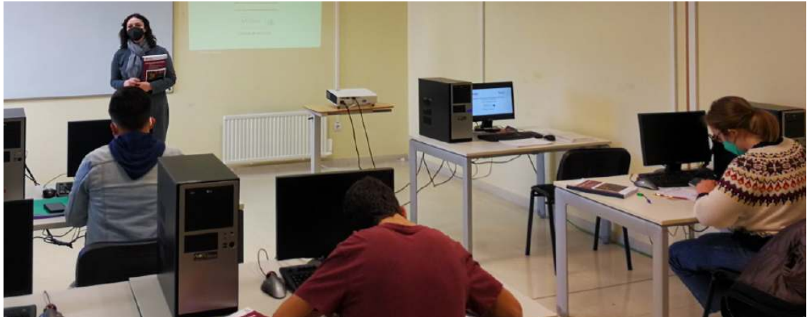
Curso en A Coruña de controlador de accesos do programa Un a un de Fundación ONCE

42 cursos realizados 8 continúan 4.907 horas impartidas