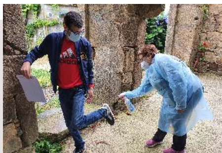
Medidas de seguridad que se toman antes de entrar en los centros

Tras el cierre obligado durante el confinamiento, los cuatro centros de recursos que gestiona COGAMI volvieron a retomar la actividad de manera presencial y con todas las medidas de seguridad, tanto para el personal laboral como para las personas usuarias.