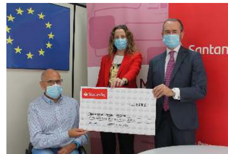
Momento de entrega a COGAMI del cheque por valor de 5.000€

COGAMI va a adquirir un total de 6.300 mascarillas quirúrgicas para el Servicio de Orientación e Intermediación Laboral (SIL), con el fin de proteger tanto al personal laboral como a las personas usuarias de este servicio que opera tanto en las ciudades como en zonas de ámbito rural.