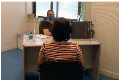
Orientadora laboral atiende a persona usuaria del servicio en Ferrolterra

Un convenio de colaboración con el ayuntamiento de Narón le permite a COGAMI mantener un servicio para dar respuesta a las demandas de personas con discapacidad de la ciudad, con especial atención a los colectivos de riesgo como son las personas desempleadas, con bajos recursos y personas que vivieron situaciones de abusos, desempleo o aislamiento social.