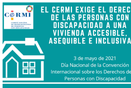
Una de las imágenes usadas en la campaña Vivienda Accesible del Cermi

El Comité Español de Representantes de Personas con Discapacidad (Cermi) exigió el derecho de las personas con discapacidad a una vivienda accesible, asequible e inclusiva, elementos esenciales para una vida independiente y participativa.