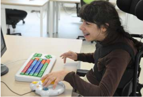
Usuaria de Ámbar manejando un producto de apoyo

La Asociación Ámbar de la comarca de Barbanza presentó el Banco de Recursos, una iniciativa enmarcada en el programa de educación inclusiva EduDiversa, que nace con la voluntad de facilitar a profesionales de la docencia los recursos que mejor se adapten a las características de su alumnado.