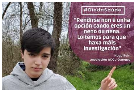
Una de las imágenes difundidas durante la campaña del Día de la Salud

Con motivo de la conmemoración del Día de la Salud, entidades de la discapacidad orgánica que forman parte de la Comisión Sociosanitaria de COGAMI lanzaron una campaña de sensibilización a través de las redes sociales.