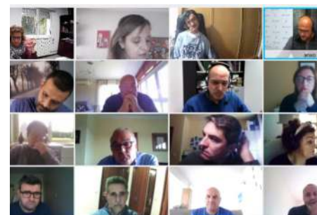
Como el año pasado, por seguridad, la asamblea fue telemática

Fue durante la XXXI Asamblea General Ordinaria celebrada telemáticamente donde COGAMI presentó el modelo de cálculo de valor social en el que trabaja desde hace dos años y que, el año pasado, trasladó a los centros especiales de empleo de COGAMI Empresarial.