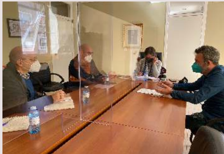
Reunión de COGAMI con la Alcaldesa de Xinzo de Limia

Con el fin de hacer que los ayuntamientos sean más inclusivos respetando lo que recoge la Ley de Accesibilidad, COGAMI mantuvo reuniones con los ayuntamientos de Santiago de Compostela y Xinzo de Limia, para asesorarlos en materia de accesibilidad.