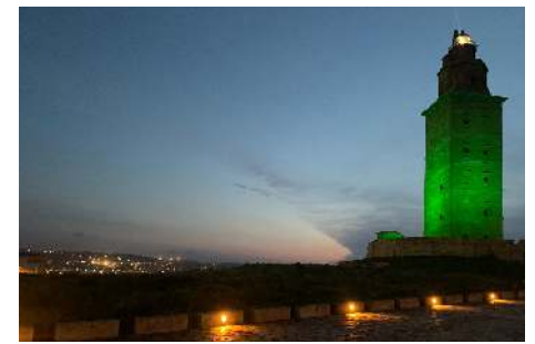
La Torre de Hércules iluminada de verde por el Día Nacional de la Fibrosis Quística

Durante la conmemoración del Día Nacional, la Asociación Gallega de Fibrosis Quística (AGFQ) pidió derechos para todas las personas que tienen esta patología, siendo una de las demandas incluir a este grupo como prioritario para la vacunación frente al COVID-19, por ser de riesgo.