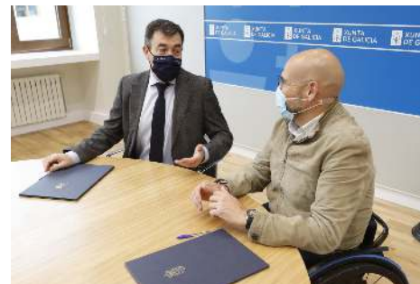
El Conselleiro de Cultura conversa con el Presidente de COGAMI tras la firma

La Consellería de Cultura, Educación y Universidad renueva, por tercer año consecutivo, la colaboración con COGAMI para llevar a cabo el proyecto En-Red-Arte, una iniciativa que tiene por objeto facilitar la formación y el acceso a la cultura de las personas con discapacidad e impulsar la cooperación entre profesionales del campo de la discapacidad y artistas.