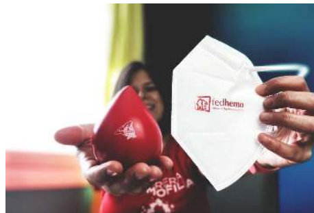
Mujer con coagulopatía participa en la campaña a través de las redes sociales

En el Día Mundial de la Hemofilia y bajo el lema 'Adaptarse al cambio: preservar la atención en un mundo nuevo', la Asociación Gallega de Hemofilia (AGADHEMO) hizo un llamamiento sobre el impacto de la pandemia en las más de 300 personas que en Galicia tienen hemofilia y las más de 500 con otras coagulopatías congénitas.