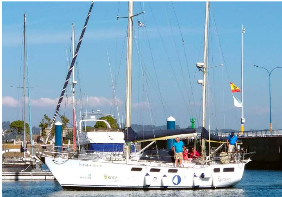
El velero Laion durante uno de los atraques a puerto