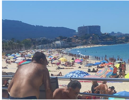
7 Septiembre 2022 convivencia en Muxía, con Asdifica Carballiño y plan Gavea de Cogami