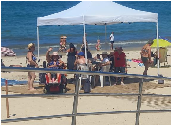
25 Julio 2022 día de playa en Vigo (Samil