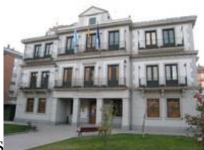
Concello do Barco de Valdeorras